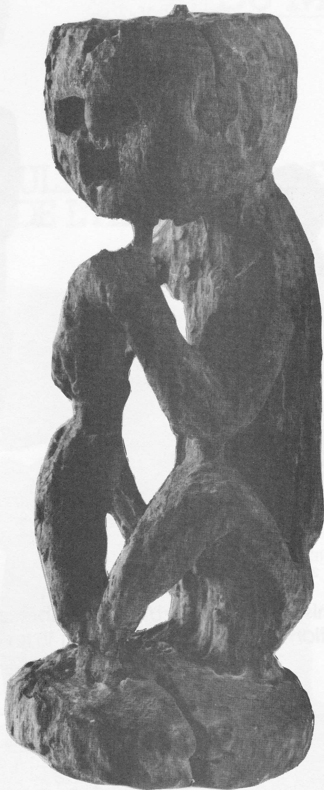
NEPAL H. 35 cm