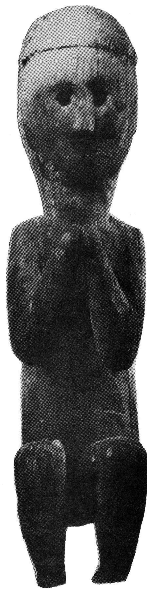
NEPAL Nord Ouest H. 72 cm

Vernissage le mercredi 2 décembre à 18 h Exposition du 3 décembre 1987 au 15 février 1988